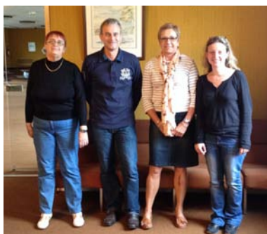
«Les Elu-e-s du secteur enfance-jeunesse-vie scolaire»