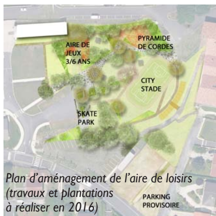
Plan d'aménagement de l'aire de loisirs (travaux et plantations à réaliser en 2016)

La réflexion a porté sur l'ensemble du site depuis la rue Curie jusqu'au Complexe sportif Colette Besson. Une esquisse d'aménagement a été soumise à concertation, à l'occasion du conseil municipal des enfants et de la réunion publique du 17 décembre dernier.