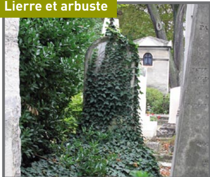
Lierre et arbuste

Couper à la base des racines et renouveler jusqu'à la mort des végétaux. Ne pas arracher.