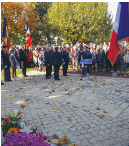
Cérémonie du 11 novembre 2018